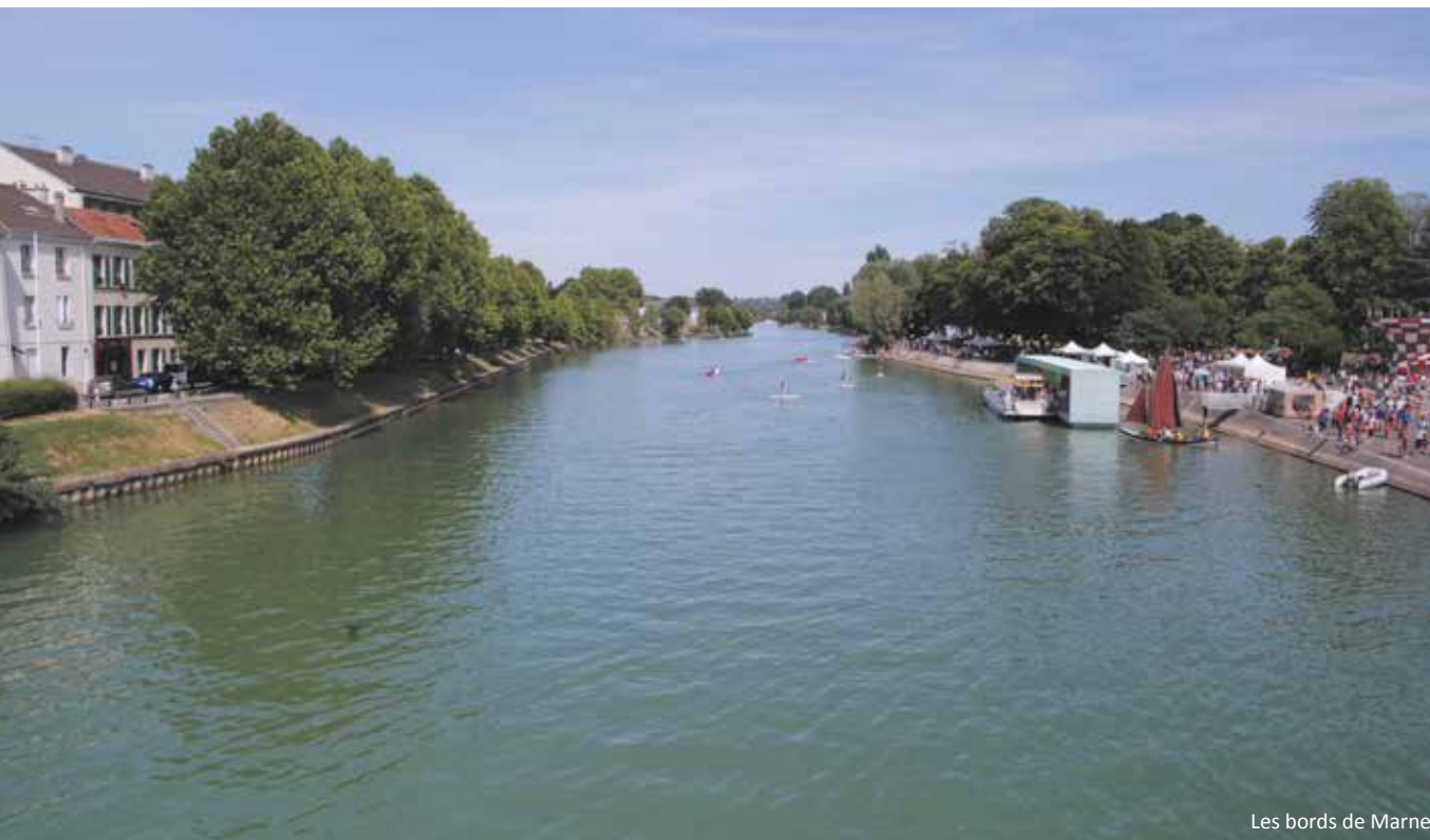
Les bords de Marne