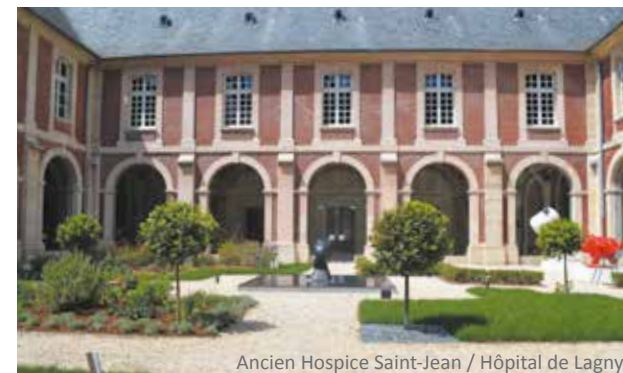
Ancien Hospice Saint-Jean / Hôpital de Lagny

Lagny-sur-Marne offre un cadre agréable et en plein renouveau, à l'image du site Saint-Jean où prend place "Altana". Ce vaste terrain de 10 hectares accueillant l'ancien hôpital de Lagny devient un lieu de vie recherché proche du centre-ville et de la gare SNCF. Autour des beaux bâtiments du XIX e siècle conservés, des réalisations contemporaines s'élèvent. Des bosquets d'arbres remarquables et des espaces verts réaménagés forment un parc public privilégié où les résidents aiment flâner. Ils profitent ainsi pleinement de cet écrin de bien-être et des vues sur les coteaux de la Marne.