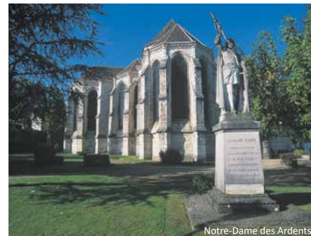
Notre-Dame des Ardens

Ces atouts lui assurent donc une dynamique constante !