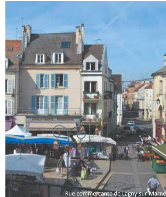
Rue commerciale de Lagny-sur-Marne