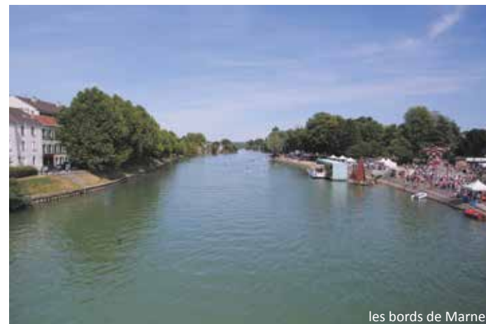
les bords de Marne