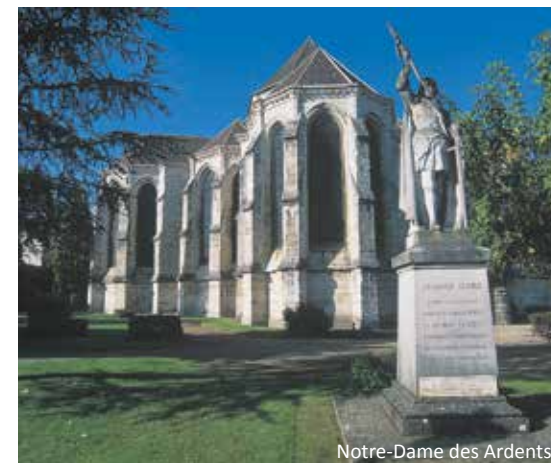
Notre-Dame des Ardents